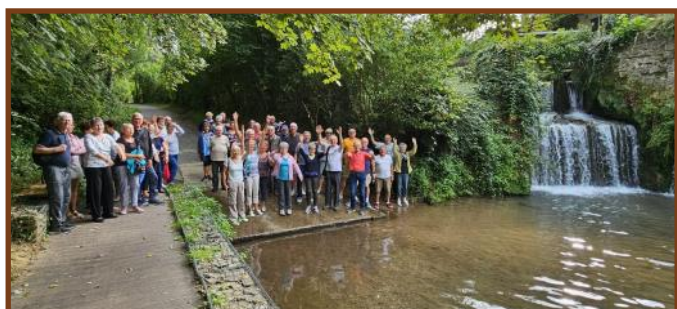
Une marche au gué de Caucourt...