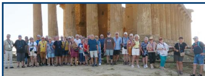
Le premier groupe